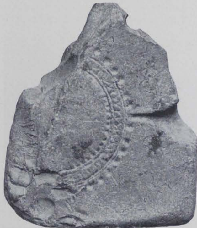
Fig. 92. — Empúries : Motllo

Es trobaren aquests vasos junt amb fragments grecs vernissats de negre que semblen del segle IV e .