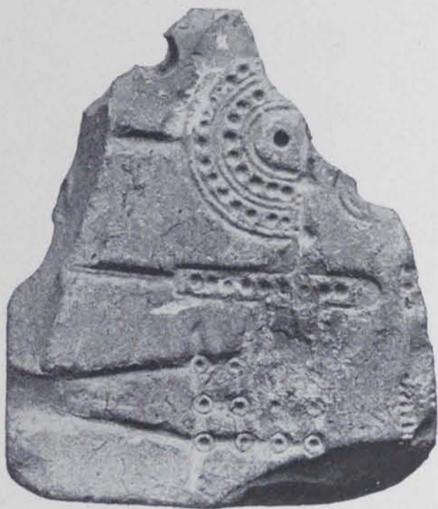
Fig. 91. — Empúries : Motllo Fot. Gandia