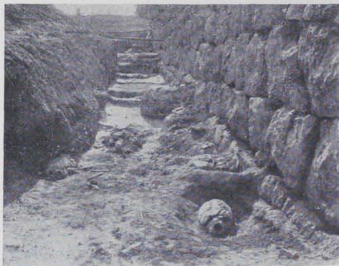
Fig. 93. — Empúries : Mur de contenció al sur del temple de Serapis