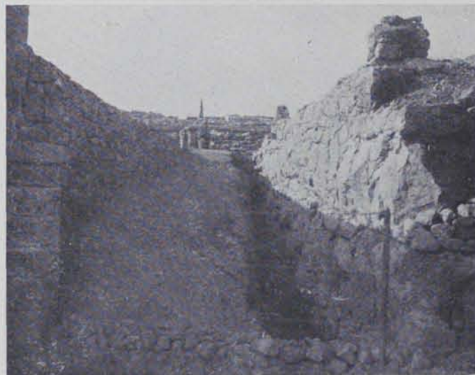
Fig. 94. — Muralla grega al nord del temple de Serapis

Entorn s'hi han descobert diversos enterraments d'incineració. El cadàver es posava en una