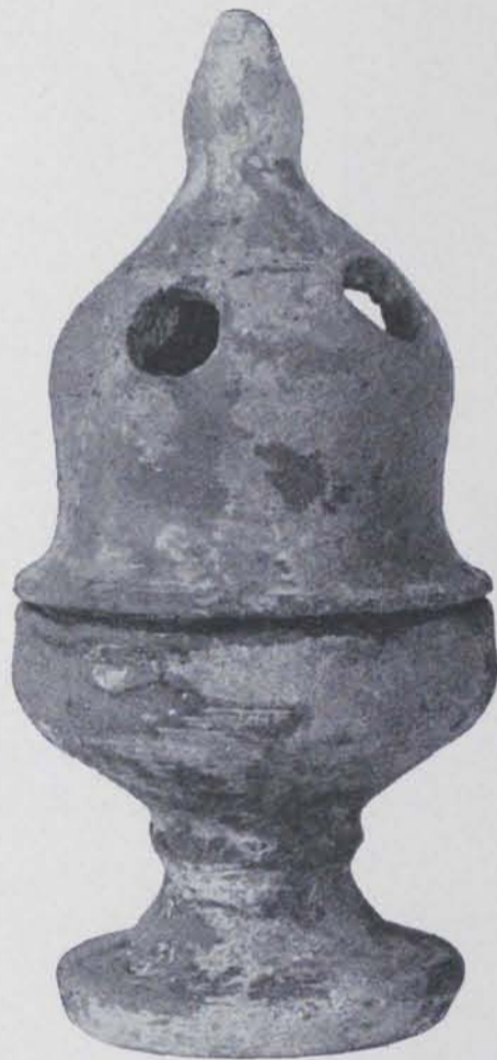
Fig. 90. — Empúries : Vas de cremar perfums

No han estat possibles encara les excavacions (1) a la Paleòpolis de la vella Emporion i solament s'han pogut recollir dades esporàdiques, com el tros de fris amb els cossos d'animals alats, obra d'escultura arcaica, que gràcies a una fotografia que ens envià el professor Schulten pogué ésser publicada. Amb aquest són tres els fragments escultòrics emporitans coneguts d'aire arcaic (2). Un pedestal i un capitell en pedra han estat trobats, al costat nord de l'antiga illa prop la muralla, a 5 m. de profunditat, pels treballadors del servei forestal.